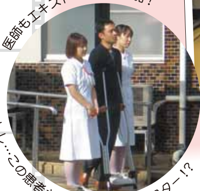
医師もエキストラとして参加!