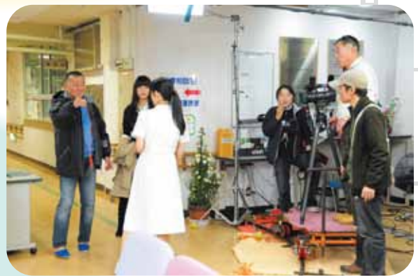
病院玄関ロビーでの撮影 面会に来られた方など映画撮影にびっくり! 一緒に楽しく撮影見学しました