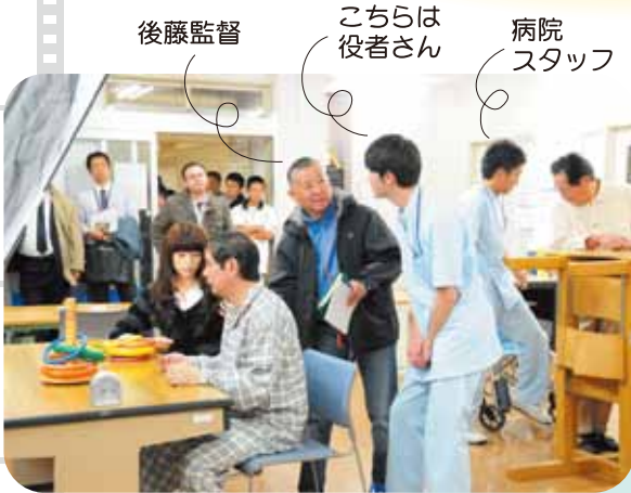
後藤監督 こちらは 役者さん 病院 スタッフ

病院でお馴染みの顔がスクリーンに登場します!ストーリーはもちろんのこと、温泉病院のシーンも楽しみにして下さい。