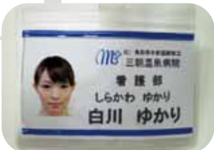
病院スタッフと同じ 名札を作製